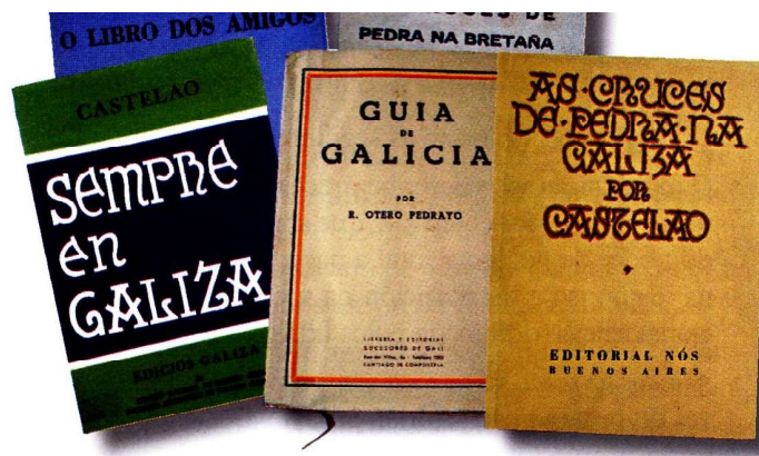
Os persoeiros do Grupo Nós cultivaron o ensaio na nosa lingua.