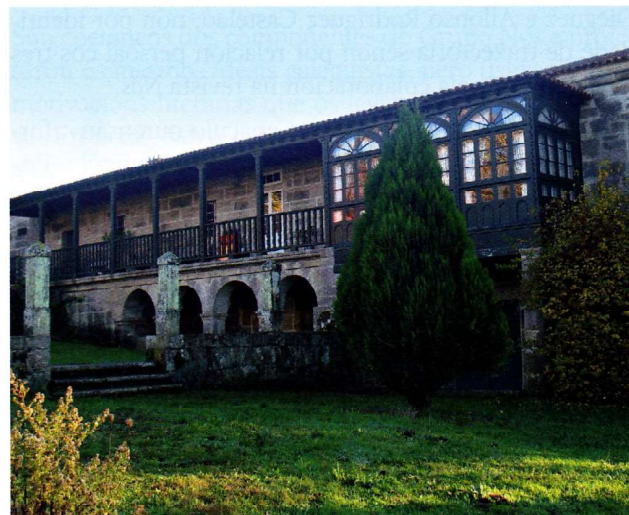
Casa patrucial de Otero Pedrayo, en Trasalba.