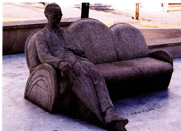
Escultura de Castelao na Praza do Humor da Coruña.

radas en dramas humanos das clases populares galegas: a emigración, a miseria dos labregos, as traxedias do mar, a soidade dos vellos, etc.