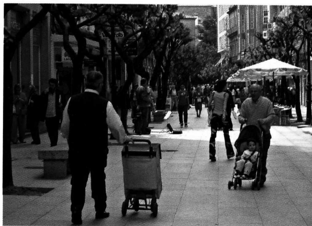
Blanco Amor ambienta as dúas novelas máis importantes na cidade de Ourense. Na imaxe, a rúa do Paseo.

Cibrán, Juan Fariña «Bocas» e Eladio Vilarchao «Milhomes» son os protagonistas da novela. Integrantes das clases traballadoras máis desfavorecidas, percorren durante vinte e catro horas os ambientes suburbanos e marxinados da cidade de Auria nunha descontrolada xolda que remata de xeito trágico.