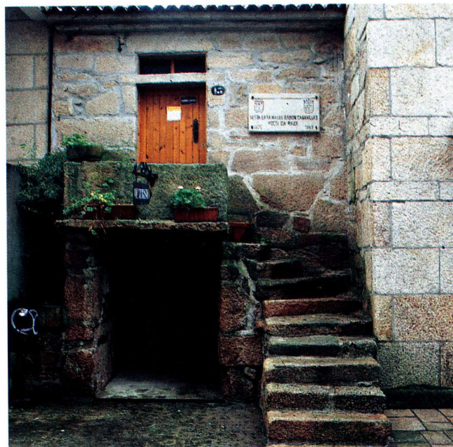
Casa natal de Ramón Cabanillas.

En 1915 regresou a Galicia con merecida sona de poeta. Volveu ao seu traballo na administración local, como secretario do concello de Mos (Pontevedra) e iniciou unha estreita colaboración coas Irmandades da Fala e co seu fundador, Antón Villar Ponte. En 1920 ingresou na Real Academia Galega. Pouco despois trasladouse a Madrid, onde fundou a primeira revista infantil en galego, As Roladas (1922).