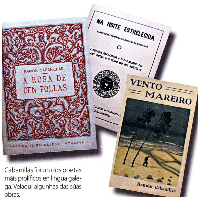
Cabanillas foi un dos poetas máis prolíficos en lingua galega. Velaquí algunhas das súas obras.