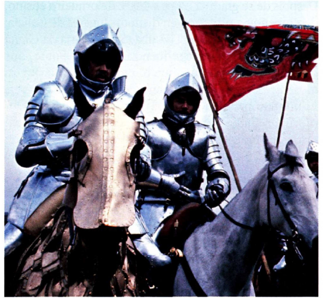
No cinema, igual ca na literatura, a materia de Bretaña inspirou numerosas obras. Na imaxe, fotograma da película Excalibur .

Nas primeiras obras, Cabanillas emprega unha lingua baseada na forma oral do galego occidental, en particular o da comarca do Salnés, aínda que rexeitando o seseo e a gheada. Igual ca noutros escritores da época, na súa lingua aparecen castelanismos incorporados na fala e hipergaleguismos, por un afán diferenciador. Mais na medida en que avanza a creación da súa obra, Cabanillas corrixe e perfecciona a súa lingua, depurándoa de vulgarismos e castelanismos, e logrando un estándar li-